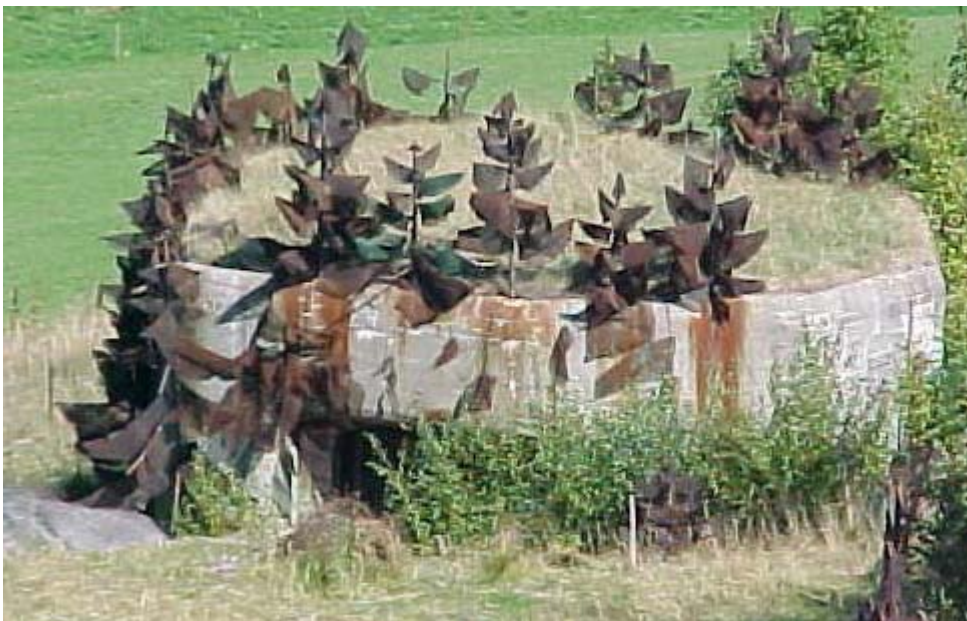
Camouflage d'un fortin par de faux sapins

mise en chantier d'un ouvrage militaire a été décidé en 1937 sur le flanc sud de la ville frontière de Vallorbe.